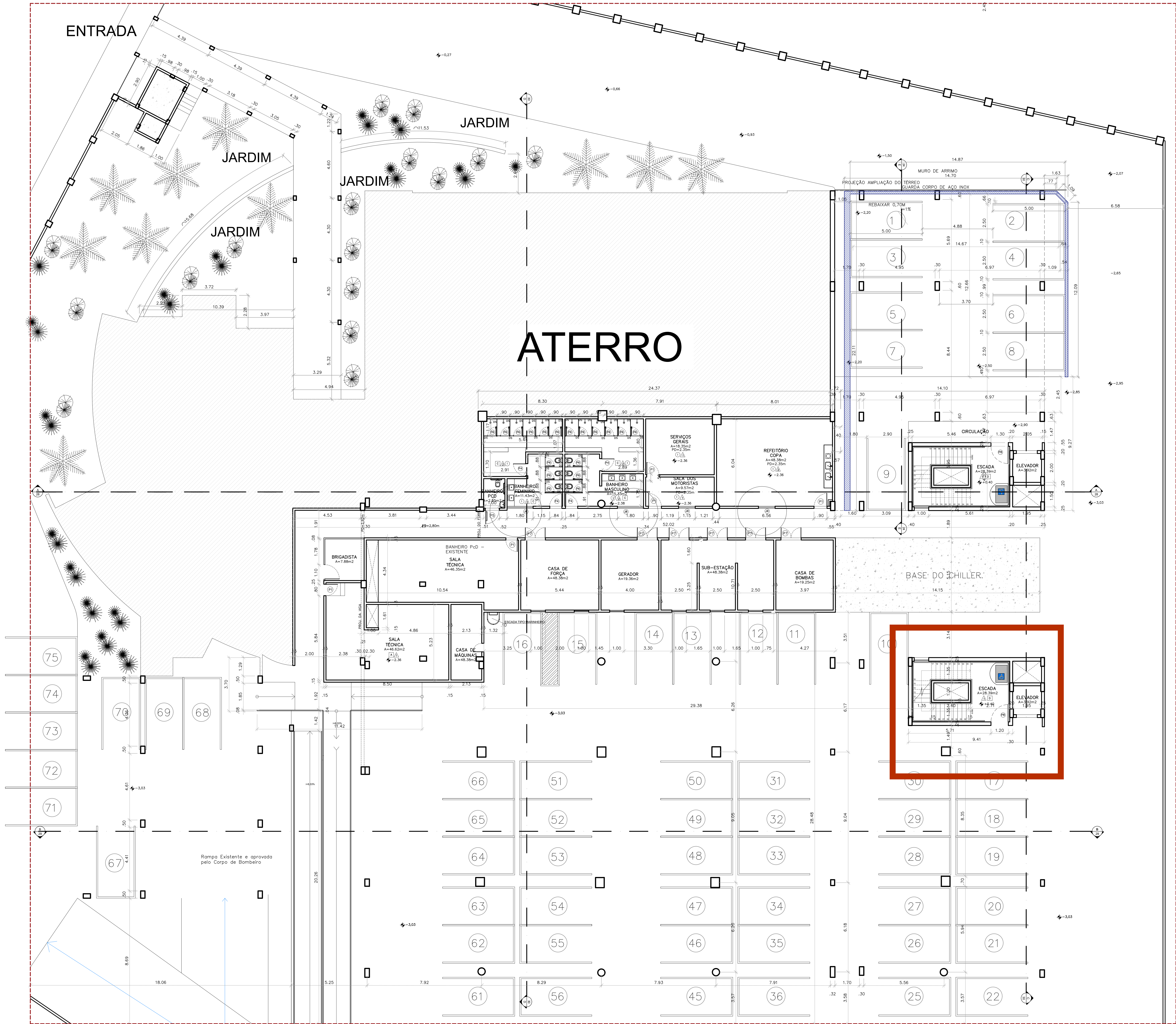
OBJETO DA LICITAÇÃO