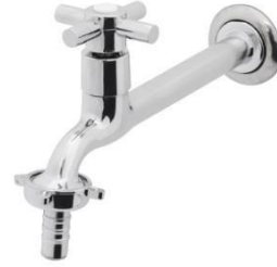
Referência de torneira cromada de parede