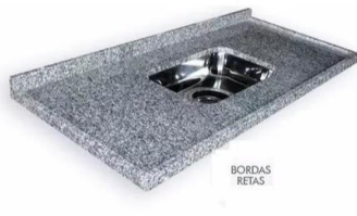
Referência de pia de granito com 1 cuba inox