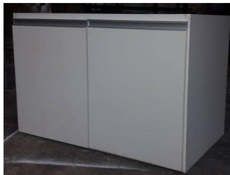
Referência armário da pia