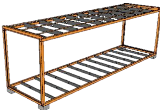
Referência de módulo fabricado