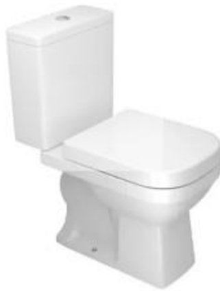
Referência de bacia sanitária com caixa acoplada