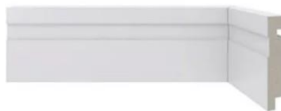
Referência rodapé em poliestireno

Paredes e divisórias: do tipo painel sanduíche, considerando lado externo em chapa lisa de aço galvanizado 0,43mm na cor verde uva, isolamento termoacústico Poliisocianurato (PIR) 50mm e lado interno em chapa lisa de aço galvanizado 0,43mm na cor branca, ambas as chapas com pintura eletrostática em pó poliéster anticorrosiva.