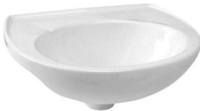
Referência de lavatório suspenso