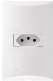
Referência de módulo de tomada