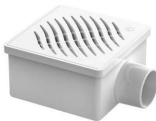
Referência de ralo de plástico