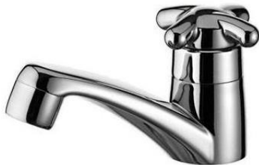
Referência de torneira de mesa cromada