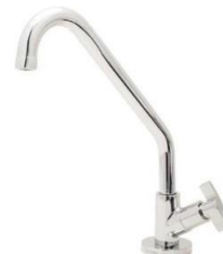
Referência de torneira de bancada cromada