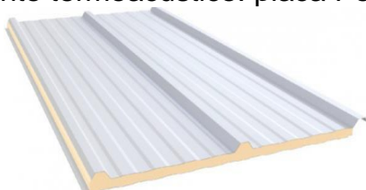
Referência telha trapezoidal