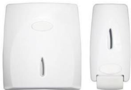
Referência de dispenser para papel toalha e sabonete líquido