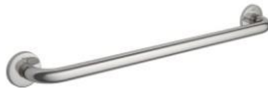
Referência barra de apoio