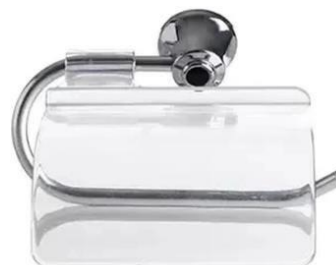
Referência de papeleira metálica cromada