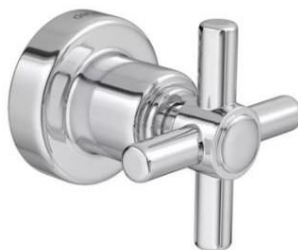
Referência de gaveta cromado