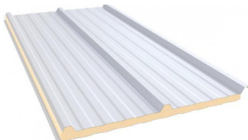
Referência telha trapezoidal