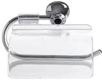
Referência de papeleira metálica cromada