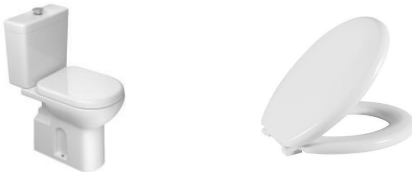
Referência de bacia sanitária com caixa acoplada e assento sanitário

Dimensões para instalação das barras metálicas próximas à bacia sanitária, referência NBR 9050/2015