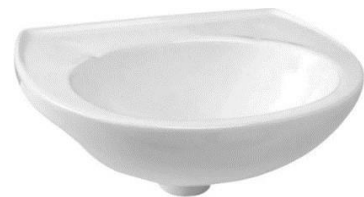
Referência de lavatório suspenso