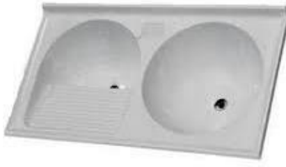
Referência de tanque de mármore sintético com 2 cubas