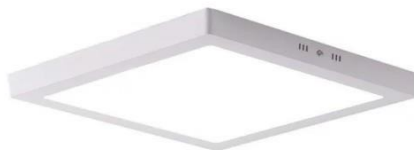
Referência de luminária de embutir