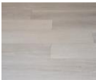
Referência piso vinílico