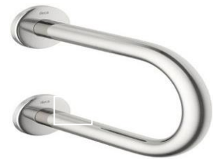
Referência de barra de apoio para lavatório