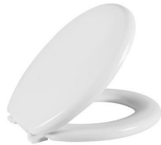
Referência de assento sanitário