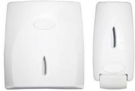
Referência de dispenser para papel toalha e para sabonete líquido